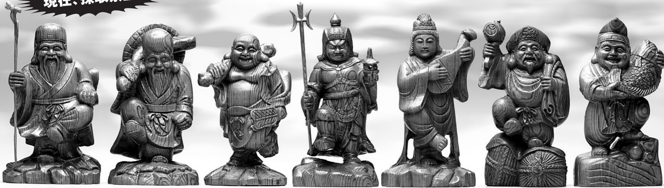
寿老人 杖を携えながら、長寿寿命と富貴吉祥を願う神様 福祿寿 長い頭に長い顎ひげ、大きな耳たぶが特徴。長寿や幸福を司る 布袋尊 笑顔と膨らんだ大きな太鼓腹で、福を運ぶ遊行僧 毘沙門天 三叉戟・宝塔を持つ武将の姿。災厄や病魔を退けるという守護神 弁財天 琵琶を奏する七福神の紅一点。財運・芸能の神としても崇められる 大黒天 打出の小櫃と大きな袋を手に、財運・福運を祈願 恵比寿天 大きな鯛を抱え、満面の笑みをたたくて商売繁盛を願う

現在、採取禁止!! 市場から消えゆく貴重な屋久杉を彫り上げた七福神。ご尊家の幸せを願う空目美しい吉祥芸術。