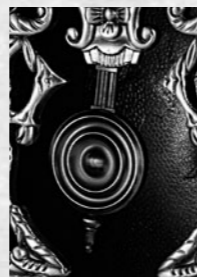
豪華な装飾に囲まれ、左右に動く振り子

■ハプスブルク家のなかでも、特に16世紀末から17世紀初頭にかけて神聖ローマ帝国の皇帝であったルドル