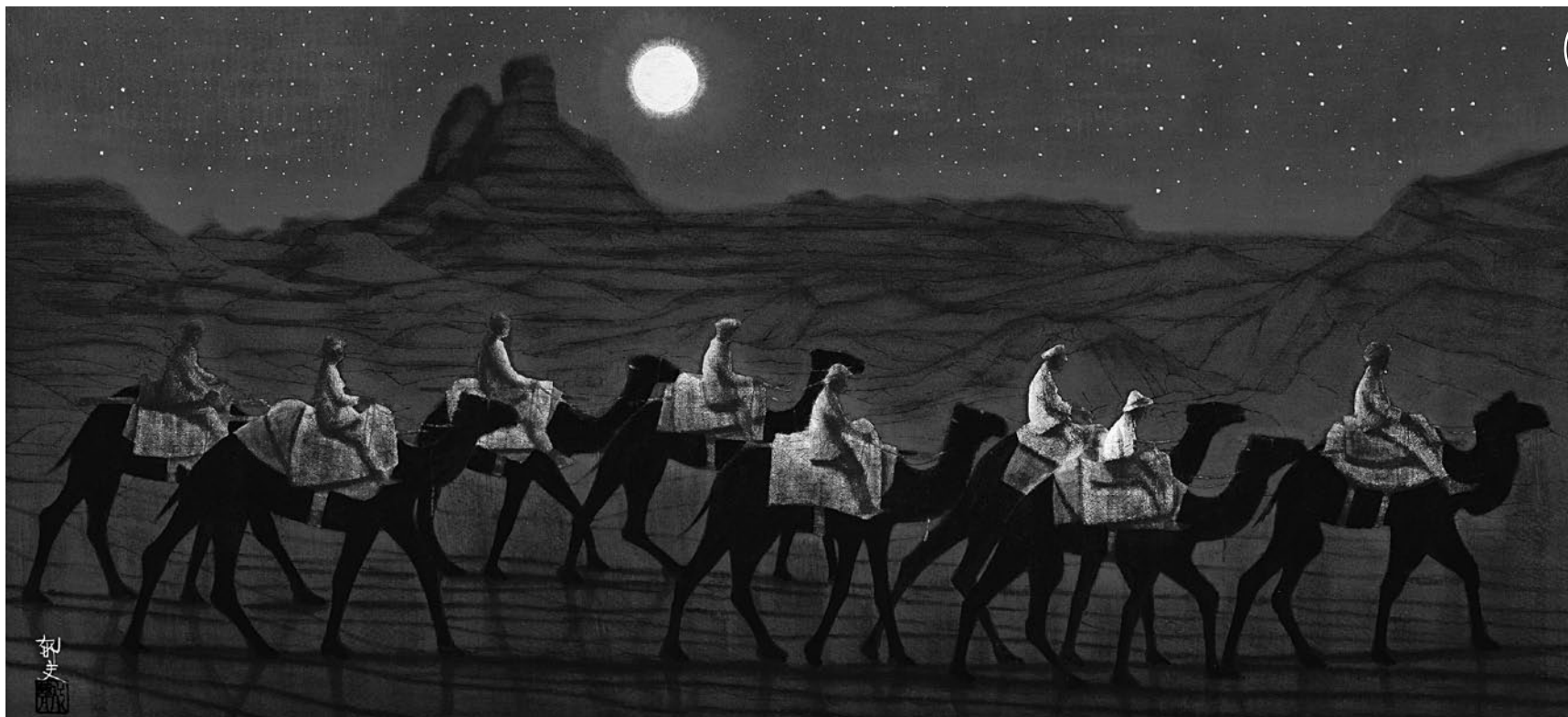
【2作共通】 ■技法:巧藝画®(特殊美術印刷に手彩色)、本金・本岩絵具 ■額素材:特装金泥縁、木製、布マット、アクリル、吊り紐付き ■画寸(約):縦32×横69.5cm ■額寸(約):縦51×横88.5×厚さ4.5cm、重さ4.3kg ■著作権者監修印入り奥付つき ■制作:(株)大塚巧藝社 ■原画制作年:2005年(平山郁夫シルクロード美術館所蔵) ■各限定20