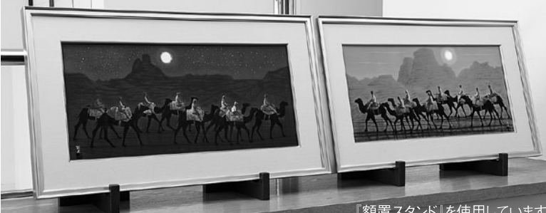
『額置スタンド』を使用しています