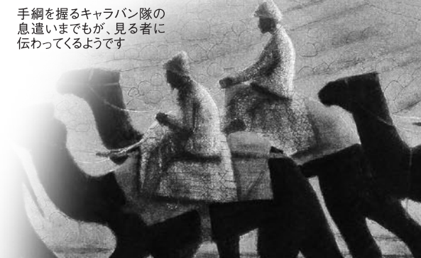
手綱を握るキャラバン隊の息遣いまでもが、見る者に伝わってくるようです

日・月セットでお買い求めいただければ ①なんと22,000円もお買い得!! 通常396,000円のところ 特別価格374,000円でご提供!! ②さらに同一エディションでお届けします