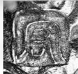
底面に作者銘入り