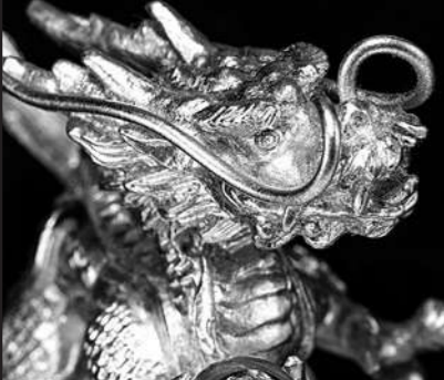
長く伸びた龍の鬚、立派な角も驚愕の細やかさで造形。発展を願うように天へ昇る龍を表現!

■本作「翠春一龍」は黄金の体躯をうねらせて、龍が飛翔する姿を見事に捉えた干支飾りです。天を仰ぎ見る眼光は力強く、跳ね上がる尾は災厄を蹴する躍動感に満ちています。純金箔を張り巡らした、鱗の一枚一枚がキラキラと輝く様は圧巻。握りしめた天然水晶の宝珠は透明度も格別で、清らかな光が満願成就を願うようです。