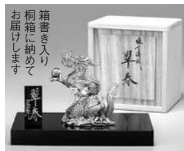
箱書き入り桐箱に納めてお届けします。

頒布価格(税込)『翠春一龍』 (実質年率12.85%) 月々14,270円×6回(計85,620円)一括82,500円