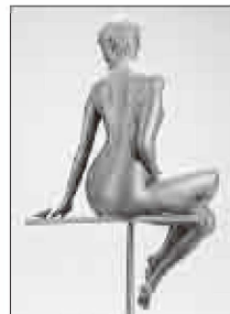
どの角度から見ても美しい姿

大道寺氏の作品の魅力は、ギリシャ彫刻の女神像を彷彿とさせる完璧な造形美と、今を生きている女性の体温さえもが感じられる躍動感です。輝くような生命力と、生きる喜びにあふれた美しい姿は、水辺の女神さながら。愛らしい小鳥に向けられた優しい微笑みからは、女性の心の内なる慈しみの想いまでもが感じられます。