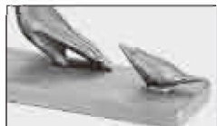
そっと差し伸べた指先に近づく小鳥

大道寺光弘氏は、1953年生まれ。国内で数々の賞を受賞するも、それに飽き足らず単身渡米。目指したのは、世界中から才能あるアーティストたちが集まる“芸術都市”ニューヨークでした。またたくまに頭角をあらわした大道寺氏は、1987年、権威あるインターナショナル・アート・コンペティションにおいて、栄えあるゴール