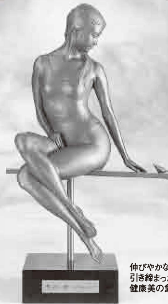
伸びやかな手足、引き締まった肢体は健康美の象徴