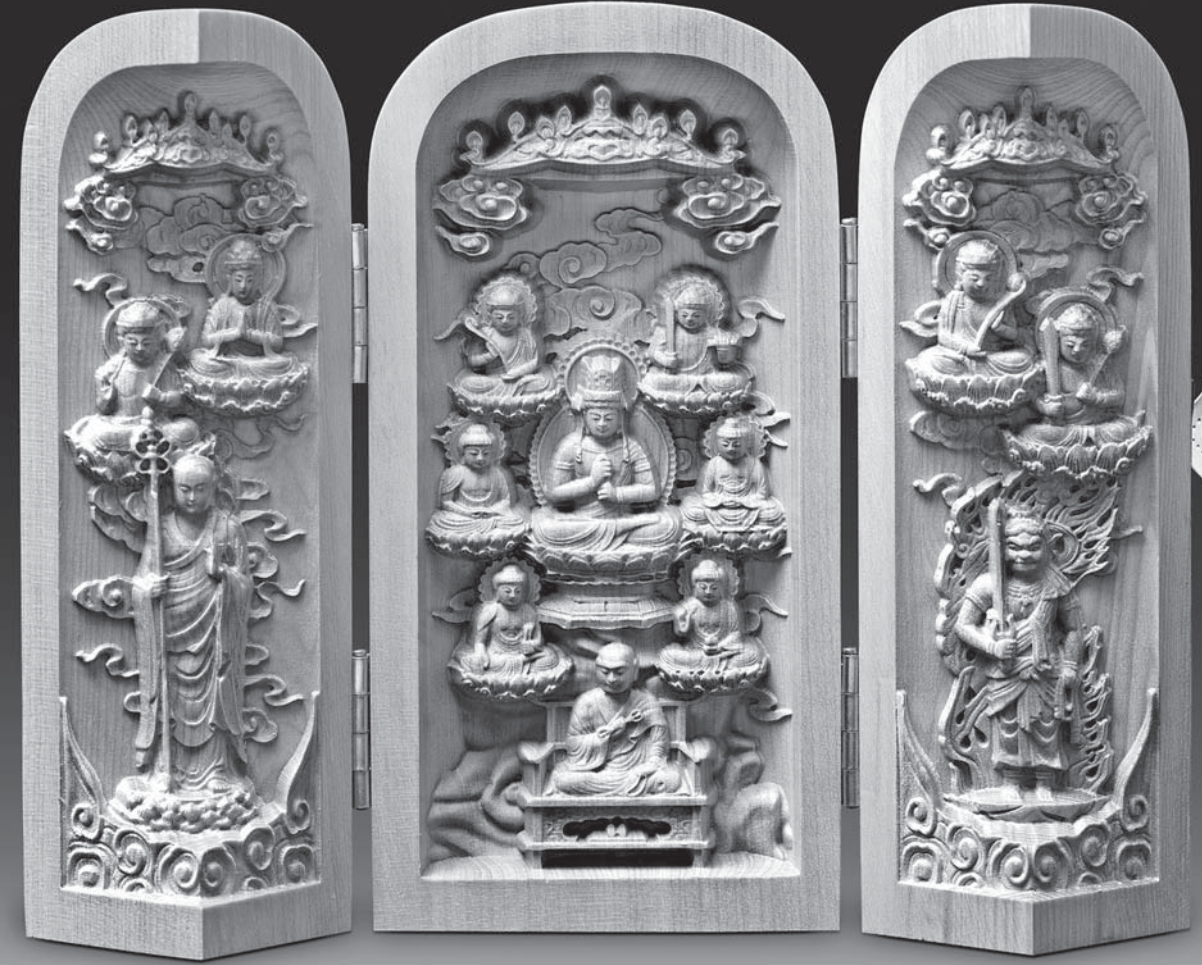
■ 素材:黄楊 ■ 寸法(約):径5×高さ10cm、重さ145g(開時幅13cm) ※天然木を用い、手作業で制作しているため、一点一点、彫り、色彩、形状、重量などが異なります。 ※金襴袋の柄・色が変更になる場合がございます。