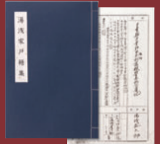
時代を感じさせる謄本類は江戸和綴りに装丁した「戸籍集」にしてお届けします。寸法(約):縦26×横18.5cm