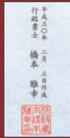
行政書士の氏名、職印を捺印

家系図の作成にはまず、戸籍関係の書類を収集する必要があります。そこで、貴方様に代わり戸籍実務に精通した行政書士が戸籍謄本や除籍簿を収集。綿密に調査した後、判明したお名前を原簿に記し、行政書士の職印つき家系図を制作します。