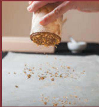
表装(本金砂子蒔き)