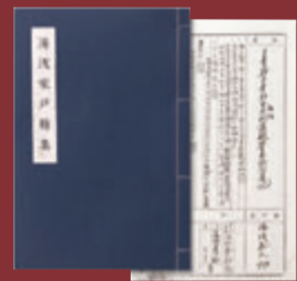
時代を感じさせる謄本類は江戸和綴じに装丁した「戸籍集」にしてお届けします。寸法(約)縦26×横18.5cm 直系の方は生没年月日を記載

原簿をもとに熟練の毛筆筆耕家が、ご先祖様のお名前を1m以上の越前本草画仙紙に長幼の序に従って、美しく書き上げます。裏打には文化財修復にも使用される薄美濃紙と、湿気や虫食いを防ぐ雁皮紙での3層打ち。見返しと尾紙には本金箔を用いた砂子蒔きの装飾を加え、正絹緞子での手表装としました。調査で取り寄せた謄本類にはお名前・住所・生没年・係累などが当時のままの字体で記され、その写しは時代感を損わぬよう、江戸和綴じ装丁の戸籍集としました。