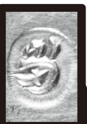
当たりを想起させる「当」が打刻された幻の縁起小判

■あらゆる勝負事の「 当たり! 」を願って、ぜひ 家宝 として代々お伝えください。ご入手いただける方は 5名様 限りです。