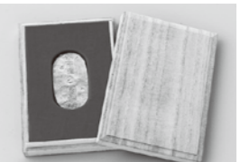
特製桐箱に納めてお届けします