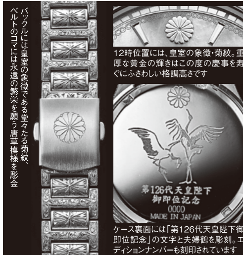
12時位置には、皇室の象徴・菊紋。重厚な黄金の輝きはこの度の慶事を寿ぐにふさわしい格調高さです

天皇陛下の益々の御健勝と令和の弥栄を願い、東京書芸館が満を持してお贈りする時の芸術品!