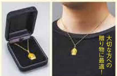
高級化粧箱に納めてお届けいたします

いる仏様をご愛用いただけます。鏡面仕上げが施された表面は御仏を艶消しにすることで、神々しいまでの威光を引き立てました。もちろん、表情豊かなご尊顔から御手の様子まで、精緻な彫りは実に写実的です。そして、裏面には般若心経。いったん手磨きをし、かなあらしという技法で全体に独特の風合いをつけた上でありがたい260余字の教えを彫り込みました。チエーンから留め具まで、すべて純金の高級品です。この好機をお見逃しなさいようお願いします。各限定5。