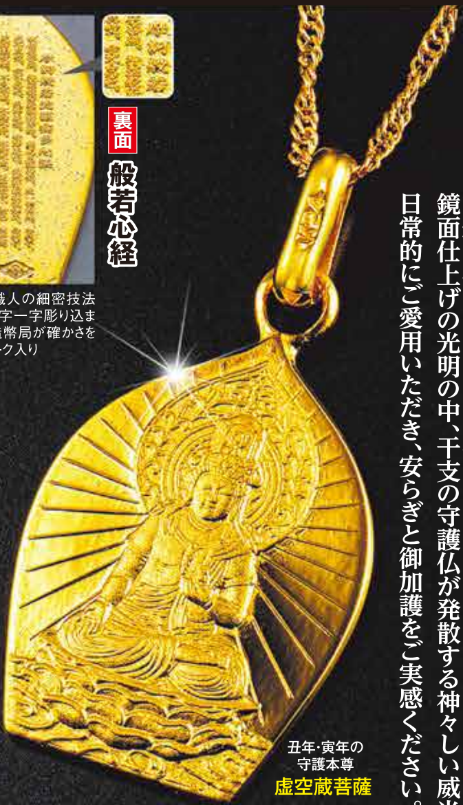
丑年・寅年の 守護本尊 虚空蔵菩薩

鏡面仕上げの光明の中、干支の守護仏が発散する神々しい威光！ 日常的にご愛用いただき、安らぎと御加護をご実感ください。