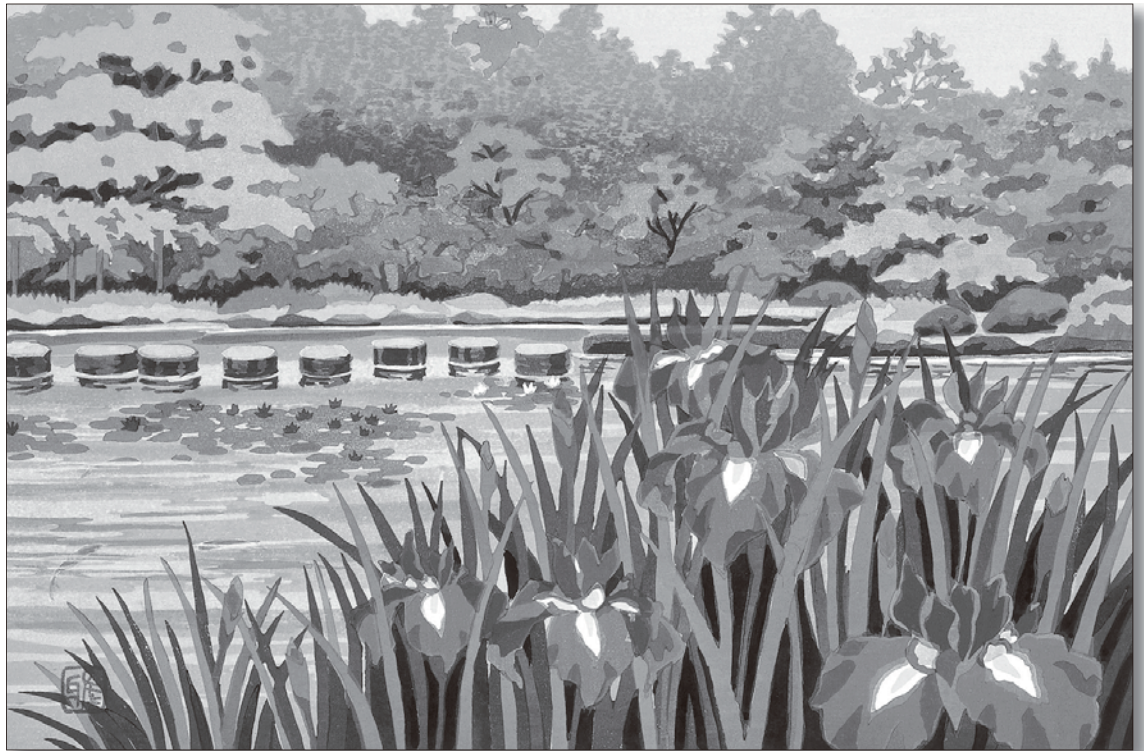
5月/菖蒲(しょうぶ) 平安神宮の蓮池、みずみずしい菖蒲の葉の匂いまで感じられる。悠然と泳ぐ錦鯉の彩り。青紫の花と木立の緑。サイズ(約): 画寸/縦21×横30.5cm 額寸/縦35×横43cm

季節のうつろいに心ときめかせ、花を愛でる日本人の感性。木版画の巨匠が、その喜びを目の覚めるような色彩で表現。