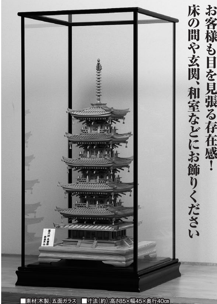
■素材:木製、五面ガラス ■寸法(約):高さ85×幅45×奥行40cm

を保証する屋久杉認定シールをお付けしてお届けいたします。なお、最後の一案内となるかもしれない今回は特別に、格調高くお飾りいただける「専用ガラスケース」を別売りにご用意いたしました。ぜひこの機会に世界自然遺産を飾る贅の極みをお確かめください。なお、稀少素材のため限定10点のみの頒布となっております。ご希望の方は、お早めにお申し込みください。