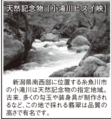
新潟県南西部に位置する糸魚川市の小滝川は天然記念物の指定地域。古来、多くの勾玉や装身具が制作されるなど、この地で採れる翡翠は品質の高さで有名です。

美しい緑と白が溶けあう神秘の色合い、 本物だけが持てる透明感に恍惚! 天然記念物の「小滝川ヒスイ峡」で 採掘禁止となる以前に入手した 特大サイズの翡翠原石をお届けします。