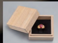
贈り物にもふさわしい 高級桐箱入り