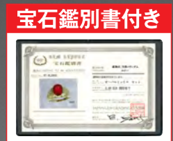
ルビーの真正性を証明します