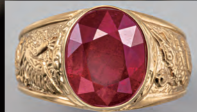
オーバルミックスカットによるキラキラとした深紅 の輝きを身に着ける喜びはひとしお