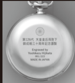
裏蓋には菊紋、彫金師名、エディションナンバー、日本製を示す刻印入り

■豪華ケースと品位ある文字盤が調和した、御成婚30周年にふさわしい懐中時計。時刻を確認する度に平成のロイヤルウエディングが思い起こされることでしょう。懐で両陛下の御心を感じつつ末長くご愛用ください。限定10。