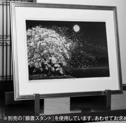
※別売の「額置スタンド」を使用しています。あわせてお求めください。

お部屋で眺める月夜の桜吹雪。幻想的な世界を盛り立てる。シャンパンゴールドの木製額入り。