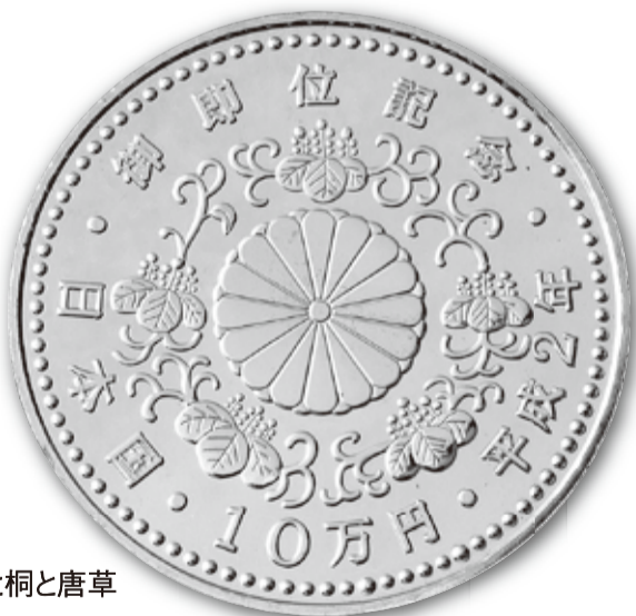
裏面： 菊紋と桐と唐草