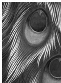
羽毛の一枚一枚が手描き! 繊細極まる色彩も必見です

■孔雀の気高き表情に、絶世のブルーがきらめく首から胴体の美しさ。そこから幾重も重なり合う飾り羽。写実極まる羽は濃淡やぼかしの技法を駆使することで、美の真髄ともいえる孔雀を描き込みました。背景に