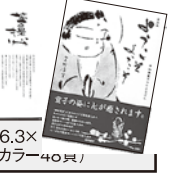
■寸法(約)縦26.3×横19×厚さ1cm(カラー40頁)