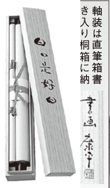
軸装は直筆箱書き入り桐箱に納