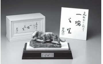
大理石天板木製台と桐箱に作者直筆（複製）の色紙つき

て千里を駆ける虎の堂々たる体軀を見れば、あふれんばかりの生命力、躍動感を実感できることでしょう。本作は招福を願う縁起物としてだけでなく、非常に芸術性の高い彫刻です。日展会長、日本彫塑会名誉会長などの要職を歴任し、近代彫刻史上、不滅の功績を残した巨匠が手掛けたのです。まさに、子孫へ代々受け継がれるべき逸品に違いありません。格調高さを演出する『木製台』と『天然大理石製天板』付きで、