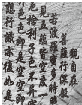
留め・撥ね・払いまで克明に刻まれた般若心経の文字