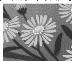
涼やかな満月の夜に浮かび上がる秋の花々を繊細に手描き