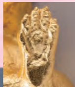
足裏の肉球まで表現する偉才のこだわり!

兔の跳躍で運氣や株の 跳ね上がりを祈願!! 本作とともに2023年を お迎えください。