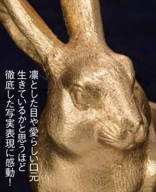
凛とした目や愛しい口元 生きているかと思うほど 徹底した写実表現に感動!